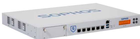
Sophos Firewall - SG210

Sie erhalten nicht nur modernste Next-Gen Firewall Sicherheit, sondern auch Funktionen, die Sie bei anderen Anbietern nicht so umfassend und in einer Lösung finden – E-Mail-Verschlüsselung, Mobile, Web, und Endpoint Security sowie Data Loss Prevention (DLP).